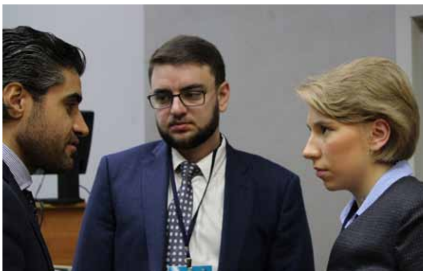
Организаторы форума и докладчики в перерыве