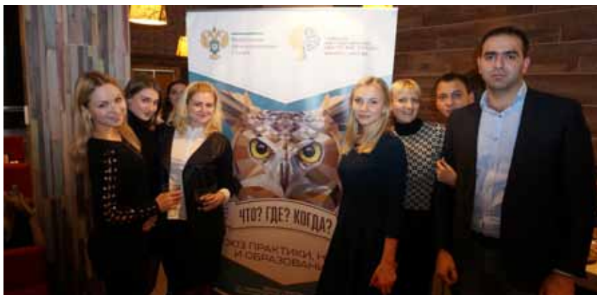
Управление регулирования в сфере ЖКХ тоже стремились к победе