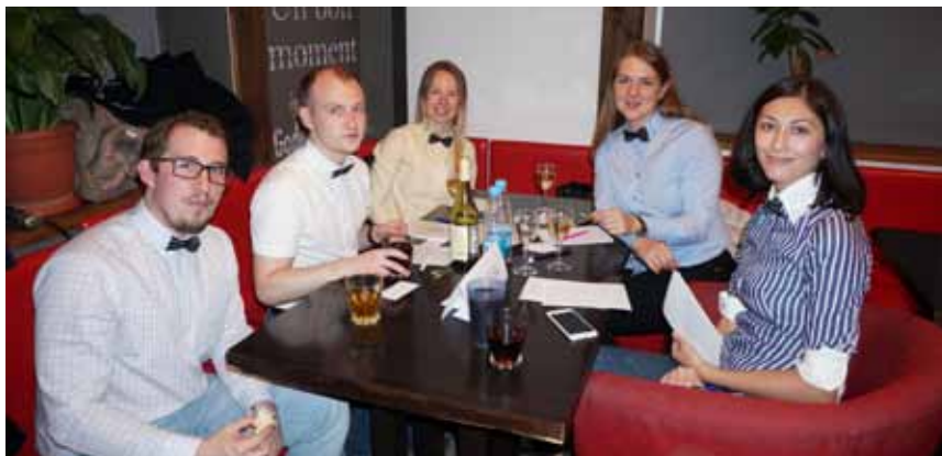
Настоящие знатоки – только в бабочках!