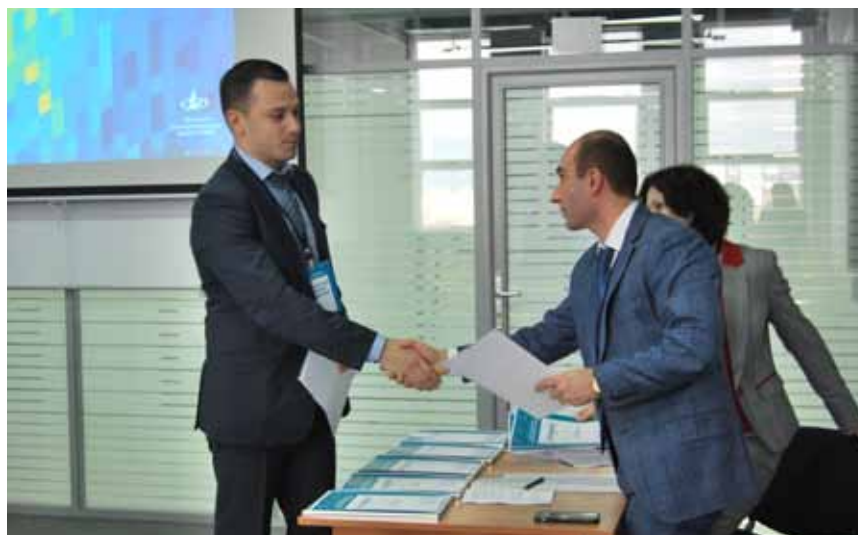
Все участники конференции получили сертификаты

Конференция продолжила свою работу по секциям, которые отразили основные направления деятельности Федеральной