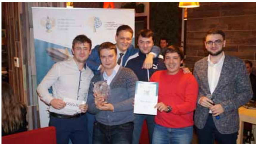
Победители – команда «GOZa-Nostra» Управления контроля ГОЗ

Победителя второго тура ждал главный приз – «Хрустальная сова», сделанная на заводе в