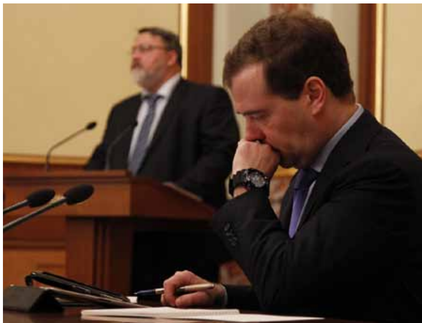
И. Артемьев выступает на заседании Правительства Российской Федерации

тельства Российской Федерации привел рынки телекоммуникаций и лекарственных средств, где удалось добиться снижения