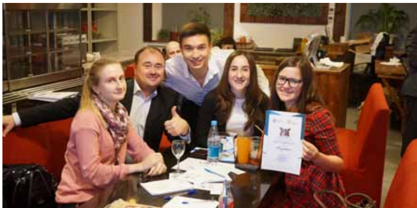
Правовому управлению немного не повезло до призового места