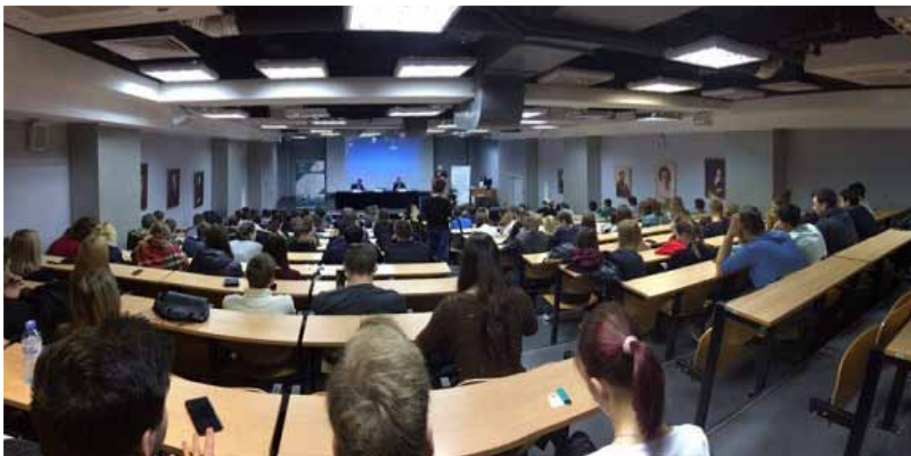
Молодежь интересуется антимонопольное регулирование