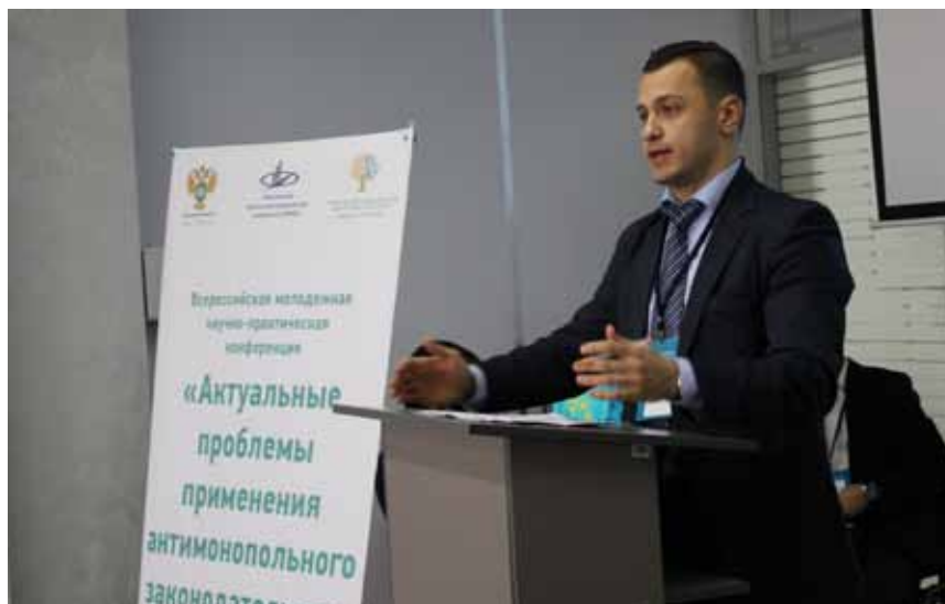
Доклады молодых ученых на секциях

Пленарное заседание завершилось презентацией Всероссийского конкурса эссе «Точка роста»