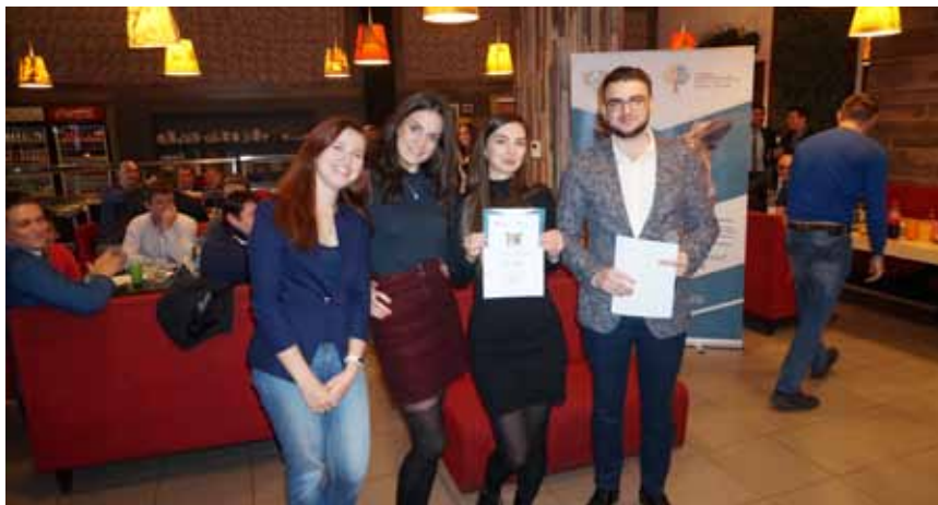
3 место – команда «No_pate» Управления общественных связей