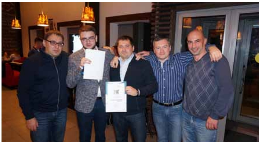
Второе место – сборная «Территориальные органы»