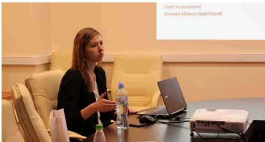
Специалисты отдела обжалования государственных закупок наиболее компетентны в реализации 44-ФЗ

24-25 октября в филиале УМЦ ФАС России (г. Москва) прошел семинар по практике применения Федерального закона № 44-ФЗ