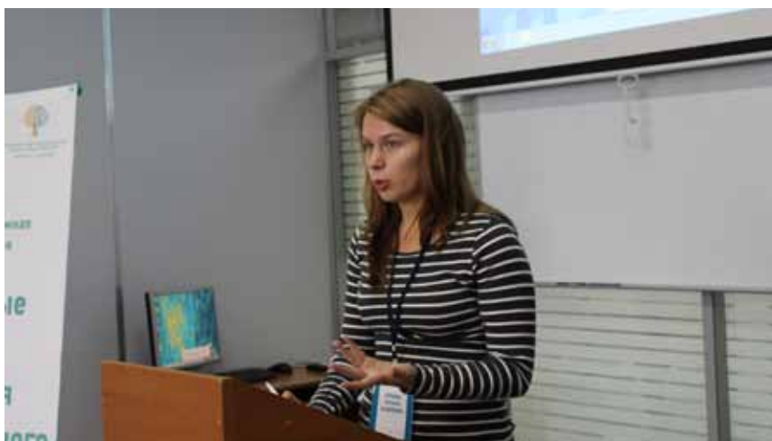
Студенты изучают конкурентное право