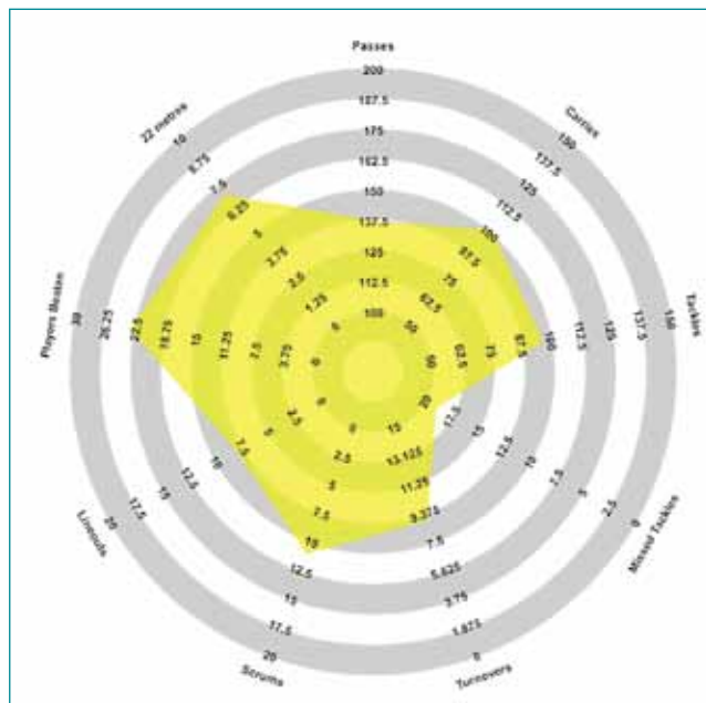
Радиограмма сборной Испании