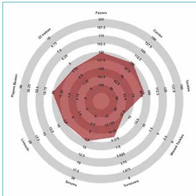
Радиограмма сборной России

чал, что еще 15 игроков, играющих во французской Топ-14, не вошли в сборную, потому что в ней слишком высока конкуренция.