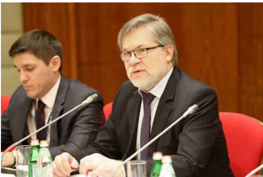
Заместитель руководителя ФАС России А. Цыганов на семинаре Организации экономического сотрудничества и развития (ОЭСР) и Федеральной антимонопольной службы по проблемам системы государственных закупок в Российской Федерации

Приказом ФАС России № 292/18 от 12.03.2018 утверждена Программа профилактики нарушений обязательных требований на 2018–2020 гг. и План-график профилактических мероприятий, направленных на предупреждение нарушений обязательных требований антимонопольного законодательства и иных нормативно-правовых актов, содержащих нормы конкурентного права, на 2018 год. План-график включает формирование общедоступного исчерпывающего перечня обязательных требований антимонопольного законодательства, соблюдение которых проверяется в ходе надзорных мероприятий, подготовку методических материалов для подконтрольных субъектов по самообследованию на предмет соблюдения обязательных требований антимонопольного законодательства, создание и тиражирование буклетов/лифлетов об обязательных требованиях антимонопольного законодательства, обеспечение информационного доступа к системе обязательных требований антимонопольного законодательства и другие мероприятия.