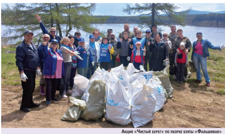
Акция «Чистый берег» по уборке бухты «Фальшивая»