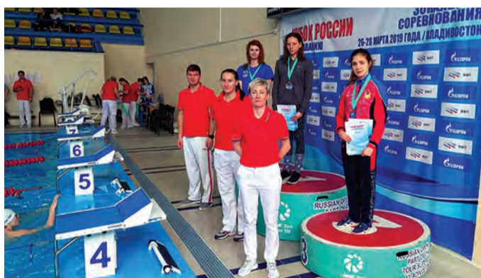
На пьедестале почета – пловцы армейской спортшколы