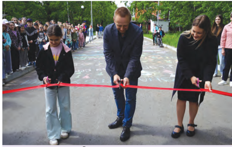
Торжественное открытие в городском парке обновленных площадок для отдыха

– Его выбрали сами амурчане. Кто бывал в Амурске, наверняка видел мозаичное панно с изображенным на нем человеком, как в полете раскинувшим руки – оно находится на центральной площади. Есть предположение, что создано панно к приезду в Амурск советских космонавтов. Поэтому при подготовке проекта на голосование вынесли два названия: «Икар над Амуром» и «Полет к звездам». Горожане выбрали «Икара». Мы победили на Всероссийском конкурсе лучших проектов создания комфортной городской среды в категории «Малые города с численностью населения от 20 до 50 тысяч человек». На его реализацию выделено девять миллионов рублей плюс в рамках софинансирования десять миллионов будет выделено от края и пятые-