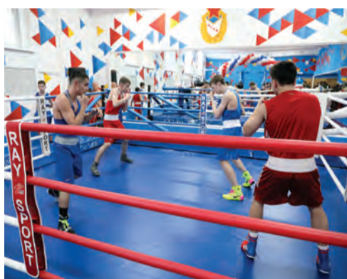
Тренировка в зале бокса

ского Клуба в ЦСКА были подготовлены 422 олимпийских чемпиона, 1736 чемпионов мира, 3752 чемпиона Европы, 15 468 чемпионов СССР и России.