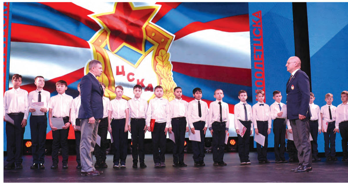
Прием воспитанников СШ (ОРК) в спортсмены-армейцы на празднике в честь 100-летия ЦСКА

Региональный центр КонсультантПлюс в городе Хабаровске поздравляет Центральный спортивный клуб Армии со знаменательным юбилеем! За 100 лет своей истории Клуб одержал множество побед, прославил отечественный спорт. Желаем ЦСКА новых высот, рекордов и достижений!